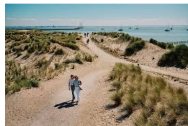
Blik op de Markerwadden

Ook leden van de PCOB zijn van harte welkom.